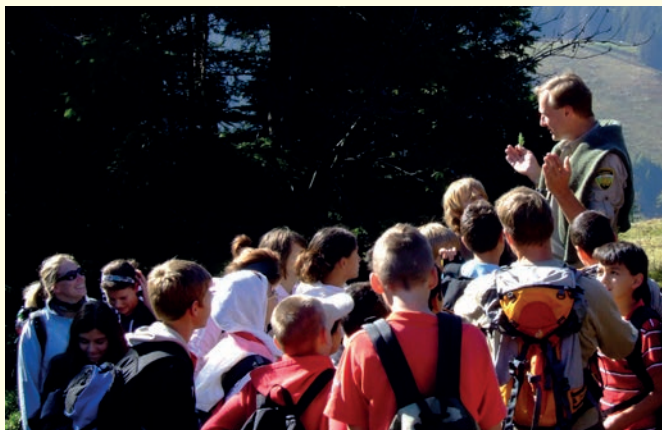
Führung am Feldberg mit dem Ranger 2014