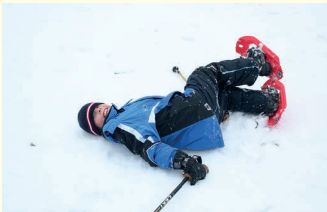
Erschöpft, aber glücklich im Schnee 2007