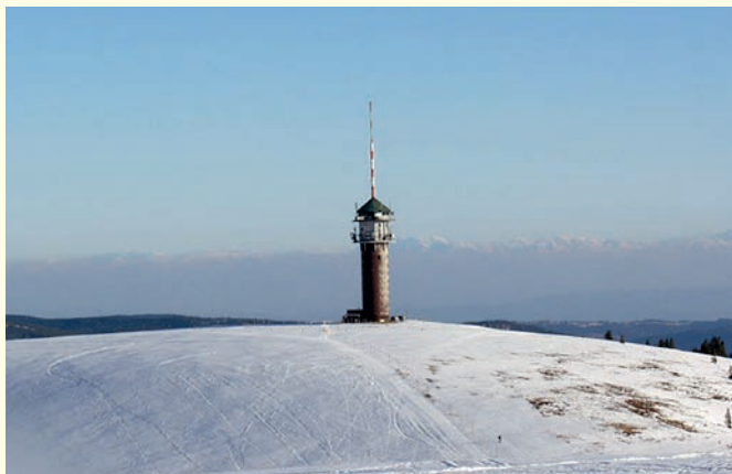
Der Seebuckturm – noch mit Antenne 2002