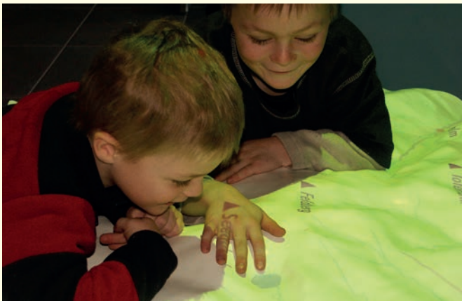
Kinder in der Ausstellung 2005