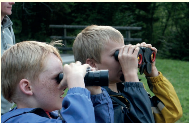
Mit dem Förster auf die Pirsch 2005