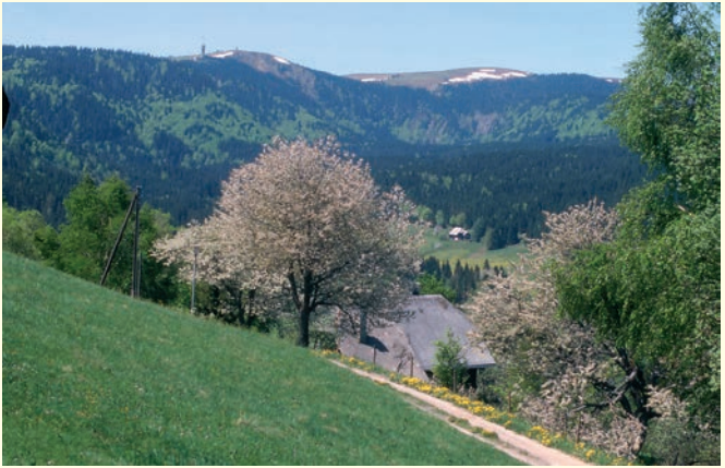
Frühlingsblick zum Feldberg 2004