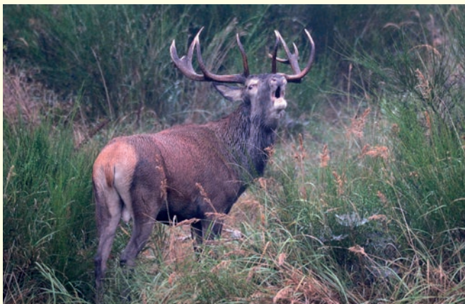
Der Rothirsch – Säugetier des Jahres 2026