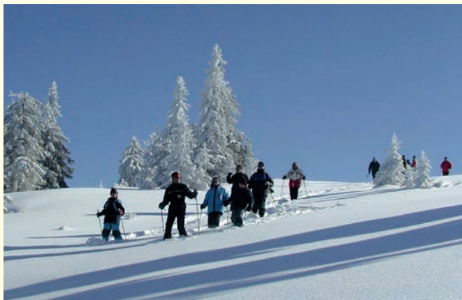
Schneeschuhtour mit Förster Martin Lipphardt 2003