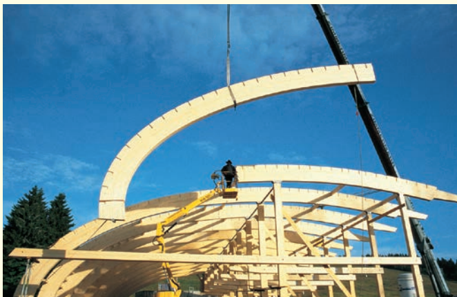
Ein langer Blick zurück: Die Baustelle des Hauses der Natur im Jahr 2000