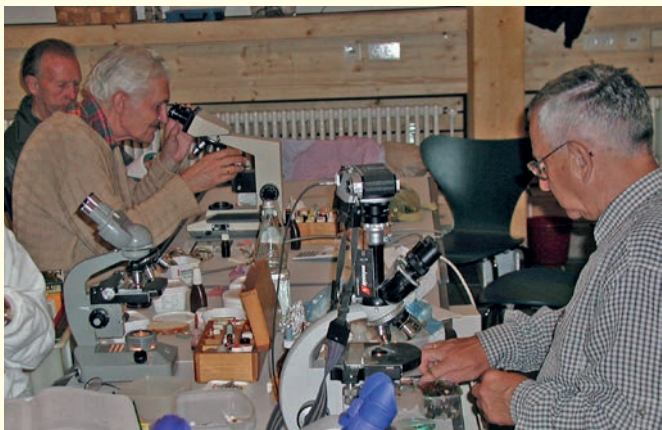
Pilzbestimmung beim GEO-Tag der Artenvielfalt 2002